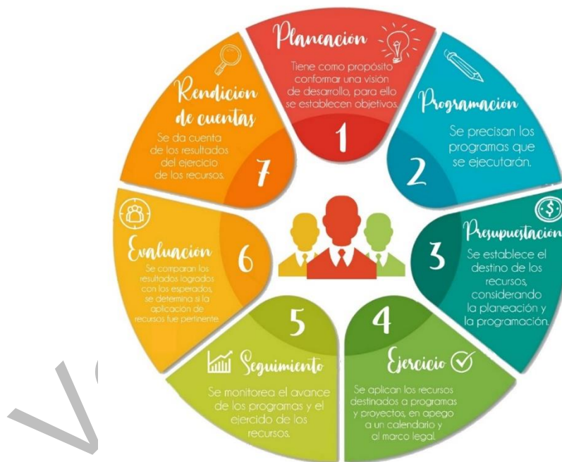
Grafico 1. Ciclo presupuestario

Por último, los programas presupuestarios son el elemento fundamental del Presupuesto basado en Resultados (PbR), el cual se constituye como el conjunto de actividades y herramientas que permite apoyar las decisiones presupuestarias en información que sistemáticamente incorpora consideraciones sobre los resultados del ejercicio de los recursos públicos, con el objeto de mejorar la calidad del gasto y promover una adecuada rendición de cuentas. Durante su elaboración se establecen objetivos, metas e indicadores estratégicos y de gestión, los cuales funcionan como instrumentos para su evaluación; además, permiten medir el impacto que se logra con su implementación.